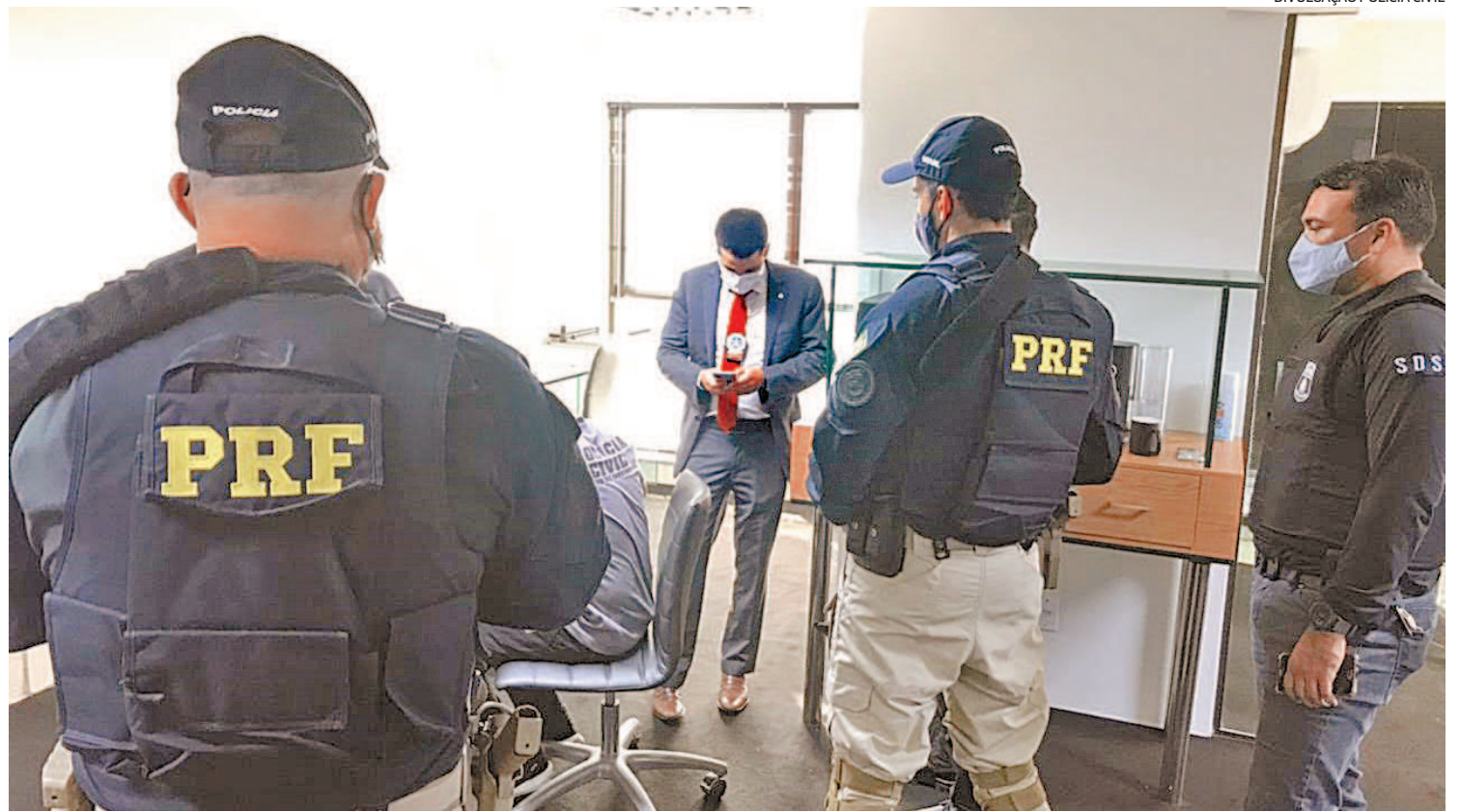
Com apoio da Polícia Civil de Pernambuco e da Polícia Rodoviária Federal (PRF), Operação 'Sine Die' apura fraudes na venda de vacinas

A companhia argumentava que participou das pesqui-