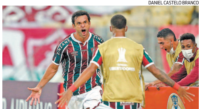
O ídolo Fred marcou na estreia na Libertadores 2021