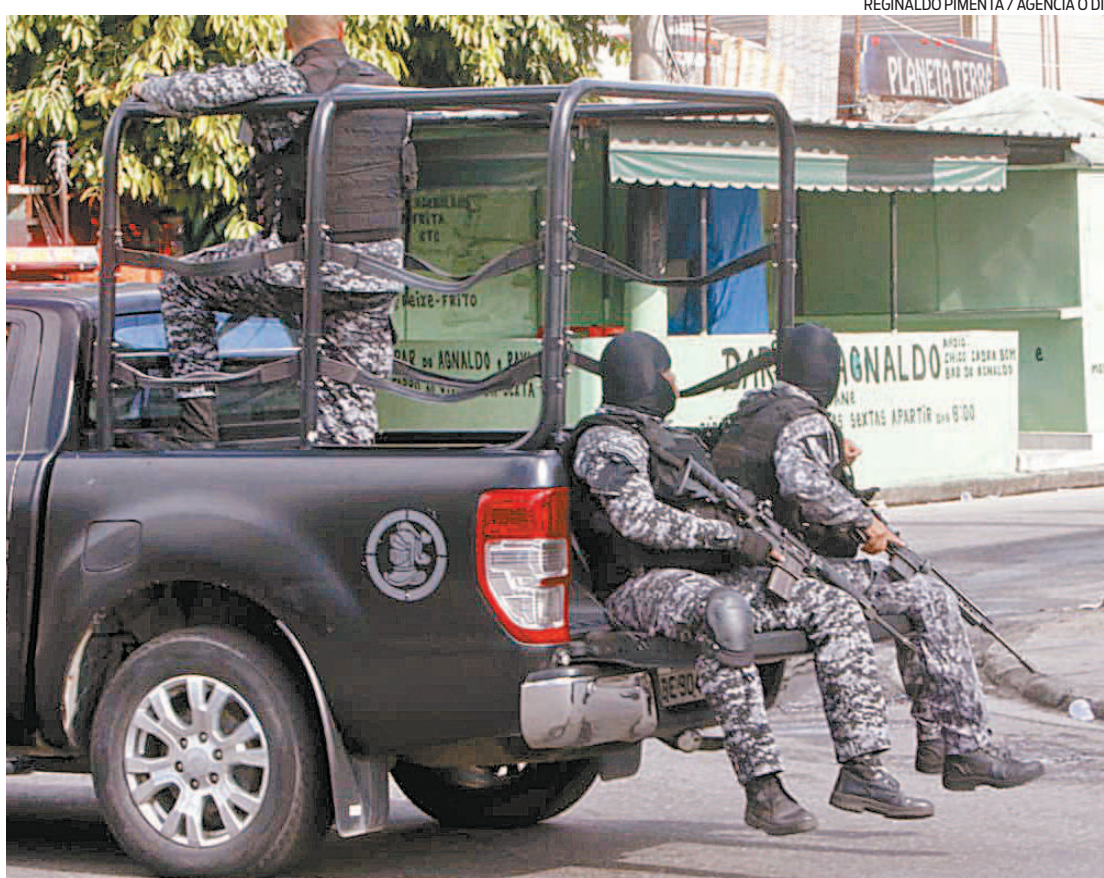
Policiais do Bope fazem buscas no Complexo do Alemão. Um cabo da PM foi baleado na cabeça

Moradores do Complexo da Maré, na Zona Norte do