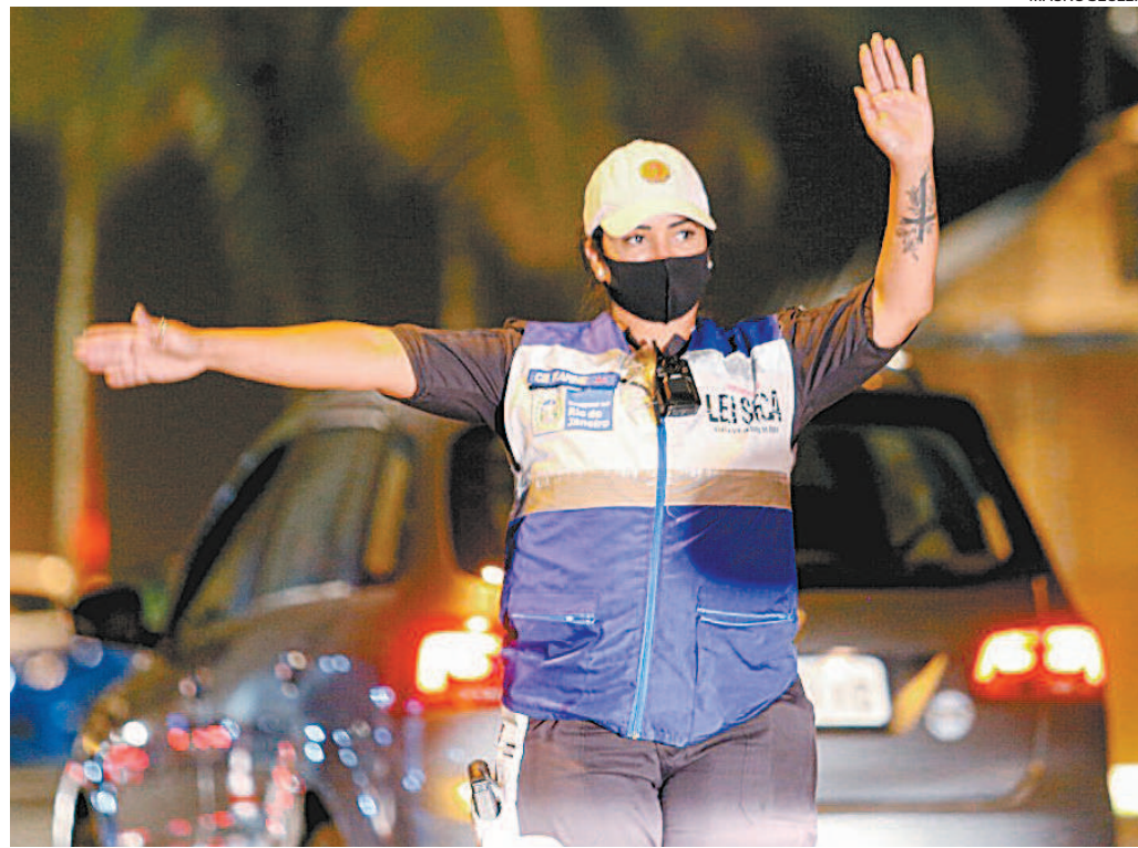
Operação Lei Seca trouxe conceito de alcoolemia zero para dirigir.

O deputado federal Hugo Leal (PSD) é o autor da Lei Seca. Tendo sido presidente do Detran, já no seu primeiro ano de mandato, o parlamentar achou que tinha que fazer algo para conter a escalada de acidentes provocados por motoristas embriagados. A lei 11.705/2008 trouxe o conceito de alcoolemia zero para dirigir, o que passou a fazer parte da legislação brasileira. A redução do número de vítimas no trânsito nos primeiros 10 anos provou que a Lei Seca tem ajudado na educação das pessoas.