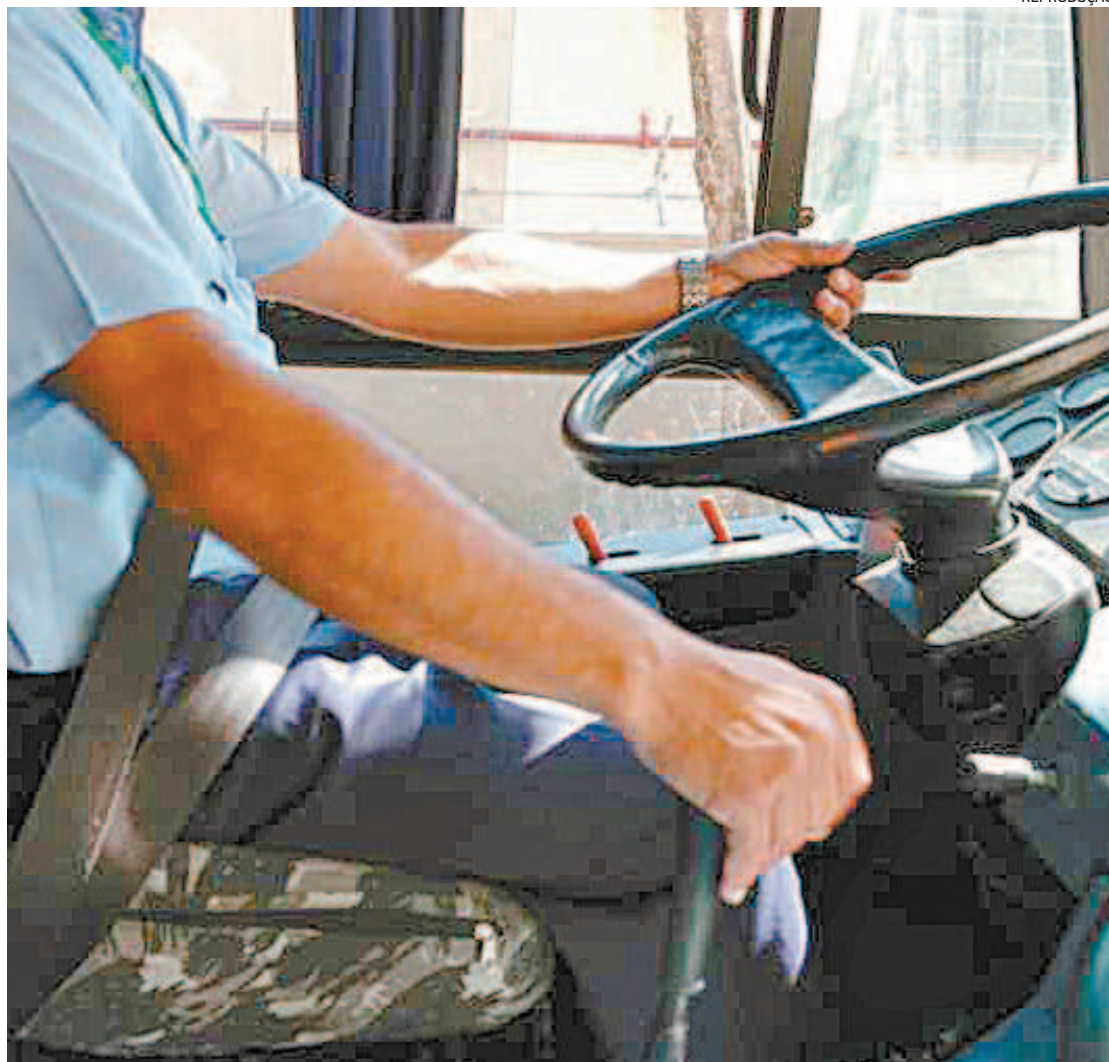
Segundo o sindicato, desde o início da pandemia foram 196 casos e 56 mortes de rodoviários no Rio

“Até o último fim de semana registramos que 50 rodoviários morreram por conta da covid-19. Esse é o número que contabilizamos, mas a realidade pode ser pior”, destacou Oliveira.