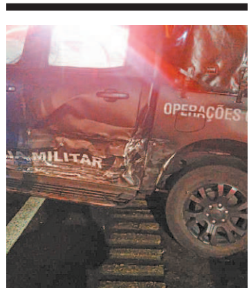
Carro do batalhão atingido

O perfil do jornal 'Voz da Comunidade' avisou nas redes sociais que "pedimos a todos ao entrar ou sair da comunidade em qualquer localidade. Há relatos de tiros".